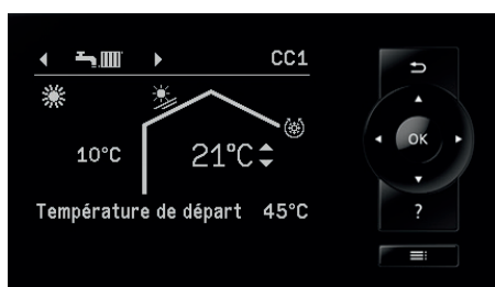
Régulation de pompe à chaleur Vitotronic 200